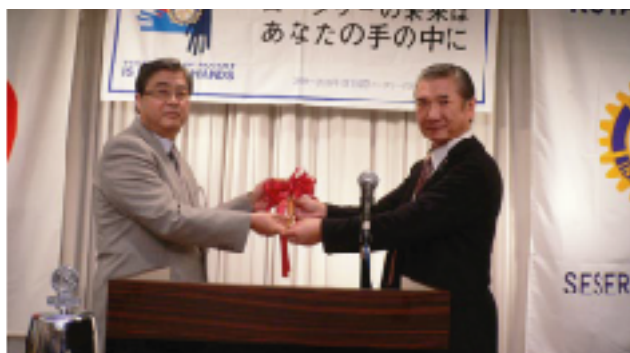
山梨会長から次年度西原会長へハンマーの引継ぎ