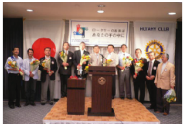
2009～10年度理事役員の皆さん