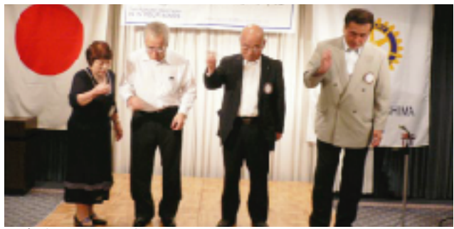
万歩計フリフリ対決