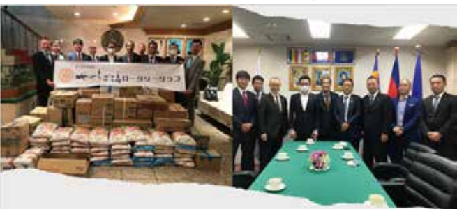
カンボジア王国大使館へお米の贈呈 コロナ禍での食料支援

せせらぎ三島RCとのつながりは5年以上となりますが、カンボジア現地での井戸掘削事業に関しては、場所の選定の情報や工事業者等ご紹介など数多くご協力いただいております。また近年のコロナ禍においてはカンボジア王国大使館の要望事項をせせらぎ三島クラブにも情報を共有させていただき、食糧支援に使用する物資を会員の皆様から頂いたお米、麺類、お菓子、飲み物等をカンボジア王国大使館まで届けていただきました。この物資のおかげで、神奈川や大阪府の留学生や技能実習生に届けることが出来、本当に感謝しております、当時のカンボジア大使と先日お会いする機会があり食事等の会話の中で、あのコロナ禍でロータリーの皆様から支援いただいたことについては生涯忘れない。本当にうれしかった。との感謝の言葉をいただきました。